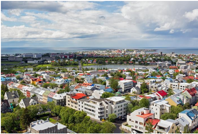
Blick auf Reykjavik